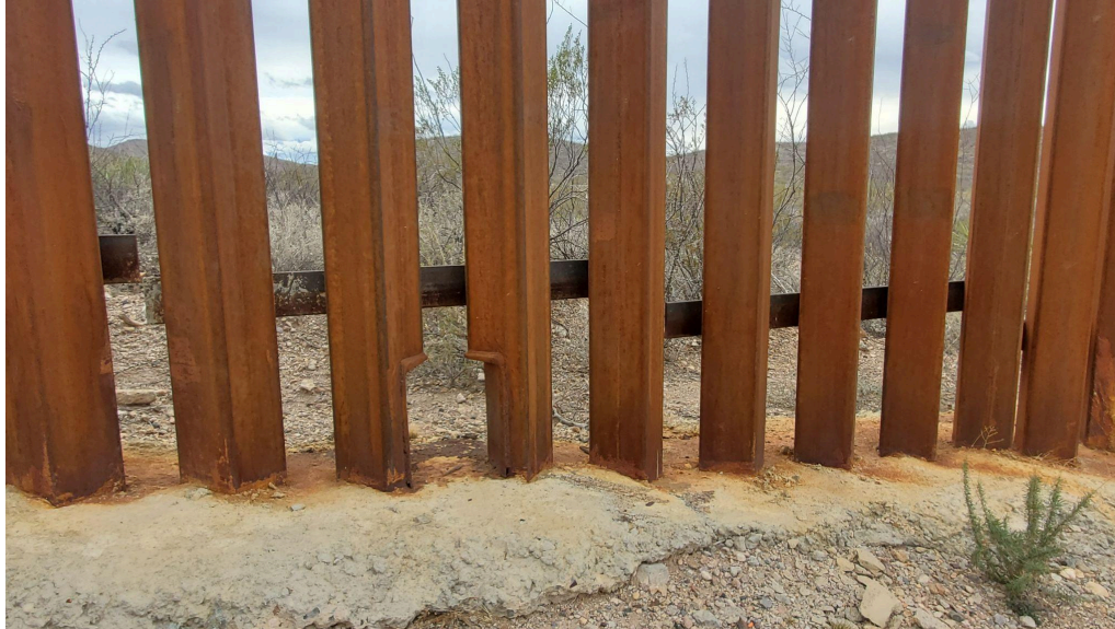
Ejemplo de cruce para animales pequeños: Foto Erick Meza