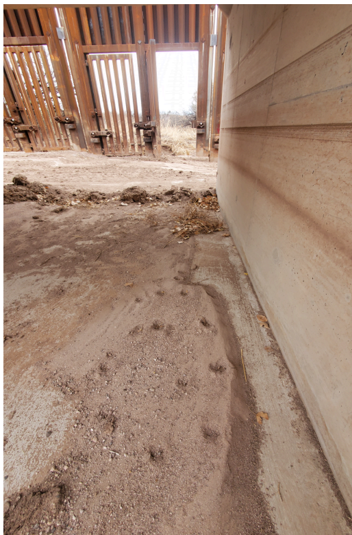
Ejemplo de compuertas de lluvia abierta.