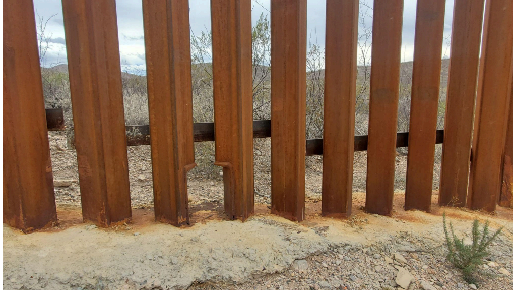
Example of a small wildlife opening.